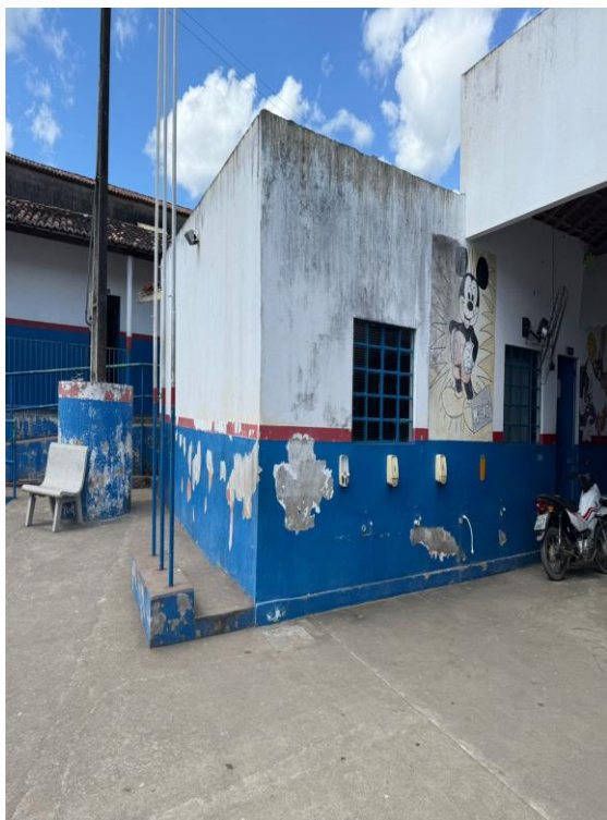
Figura 11 - Pátio Anexo (Área a ser coberta)