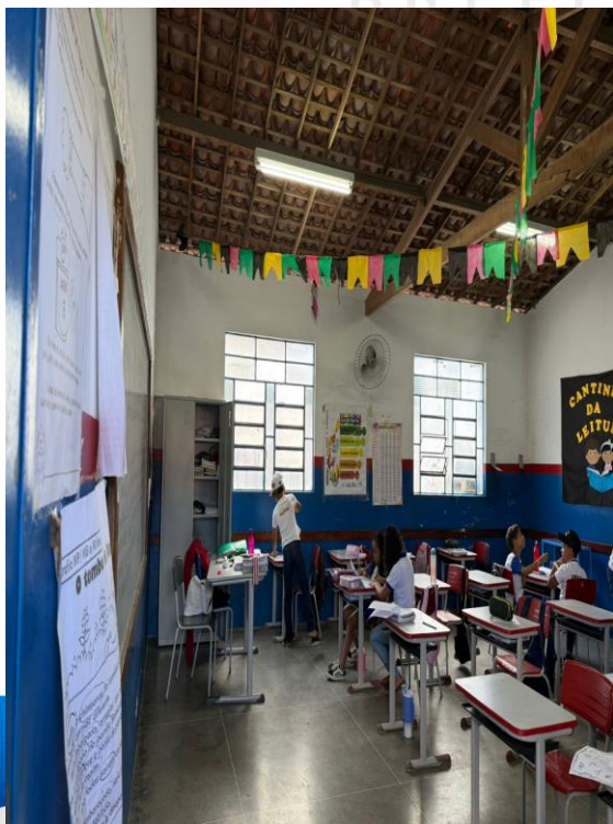
Figura 29 - Salas de aula (Instalação de forro de gesso)