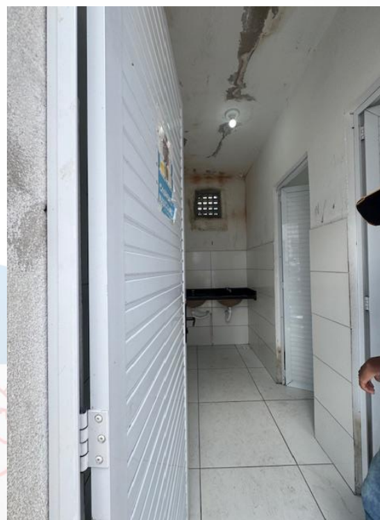
Figura 12 - Manutenções gerais