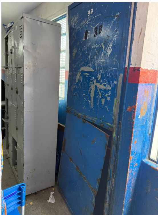
Figura 24 - Manutenções gerais