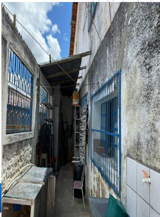
Figura 9 - Lavanderia (Área a ser coberta)