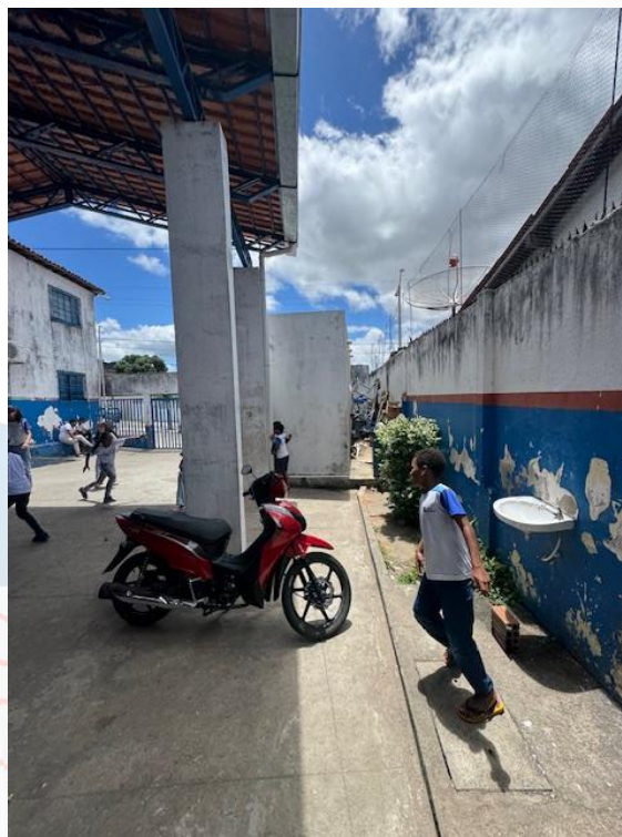
Figura 4 - Pátio (Instalação de lavatórios suspensos)