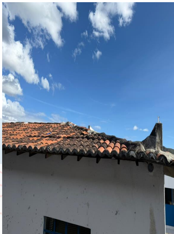
Figura 28 - Manutenções gerais Anexo