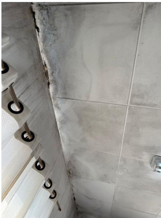
Figura 35 - Manutenções Gerais Anexo