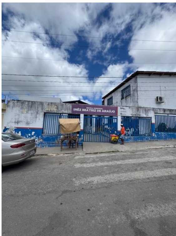
Figura 1 - Fachada Frontal (Pintura)