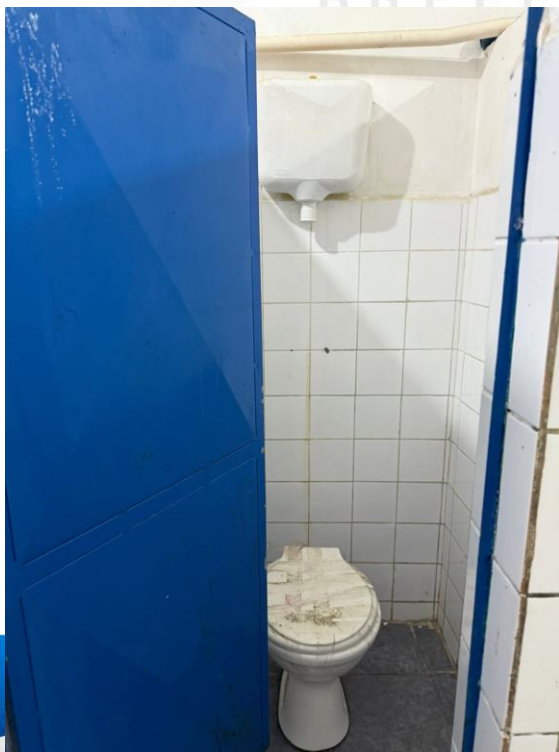
Figura 33 - Manutenções Gerais Anexo