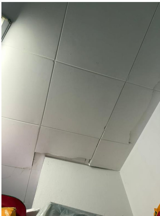
Figura 27 - Manutenções Gerais Anexo