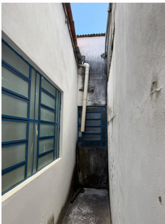
Figura 7 - Corredor Secretaria (Interligação de tubo)