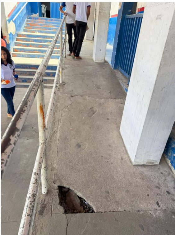
Figura 19 - Manutenções Gerais