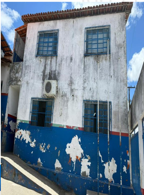
Figura 25 - Manutenções Gerais