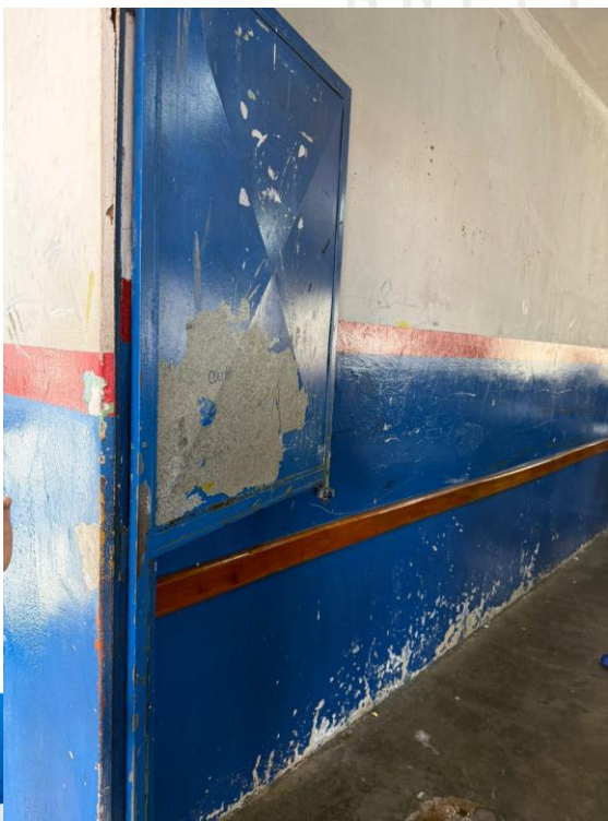
Figura 21 - Manutenções Gerais