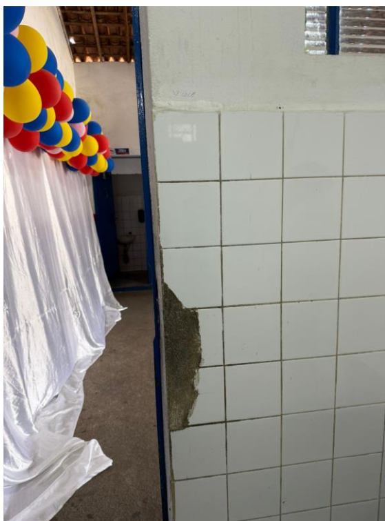
Figura 31 - Manutenções Gerais Anexo