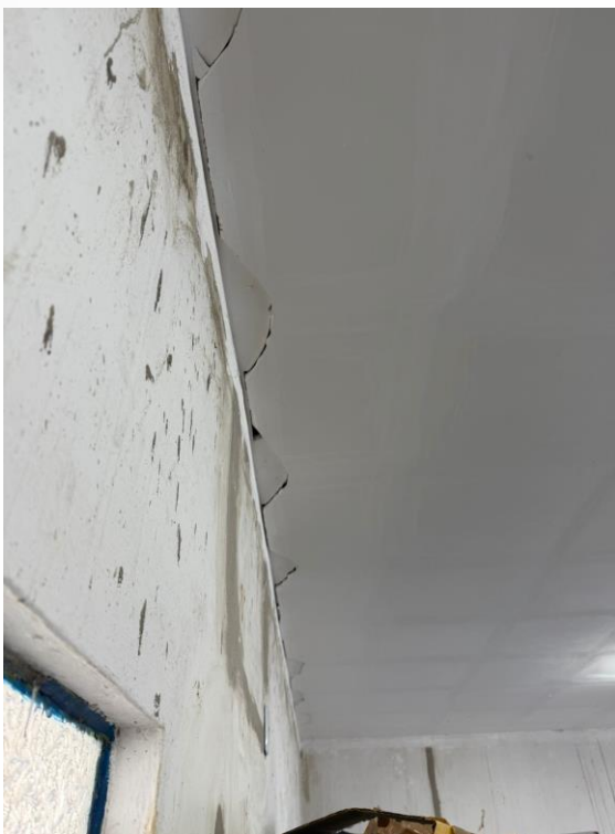
Figura 23 - Manutenções Gerais