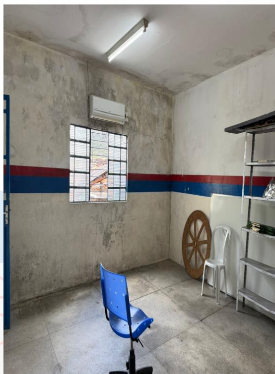
Figura 8 - Sala Professores (Parede a ser demolida)