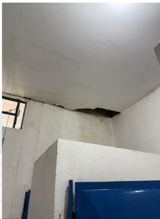
Figura 32 - Manutenções gerais Anexo