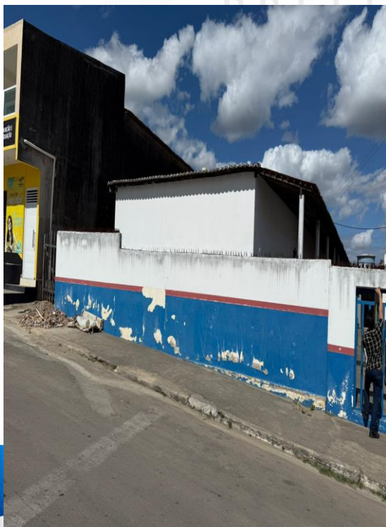
Figura 37 - Manutenções Gerais Anexo