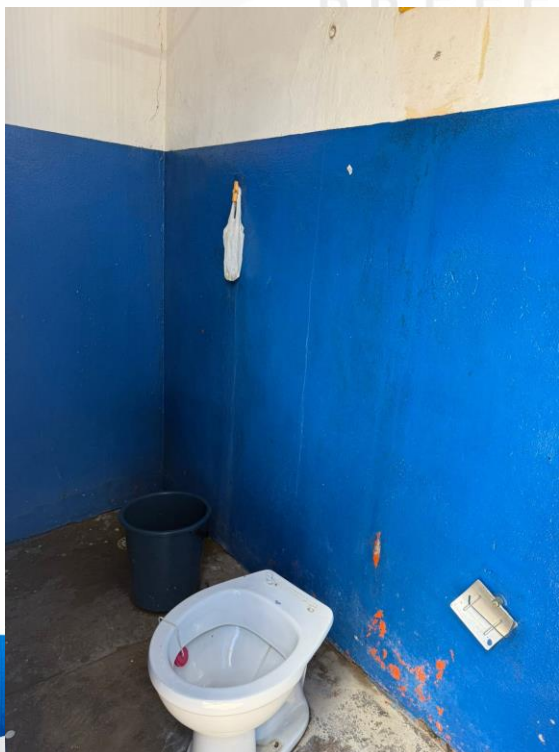
Figura 17 - Manutenções Gerais