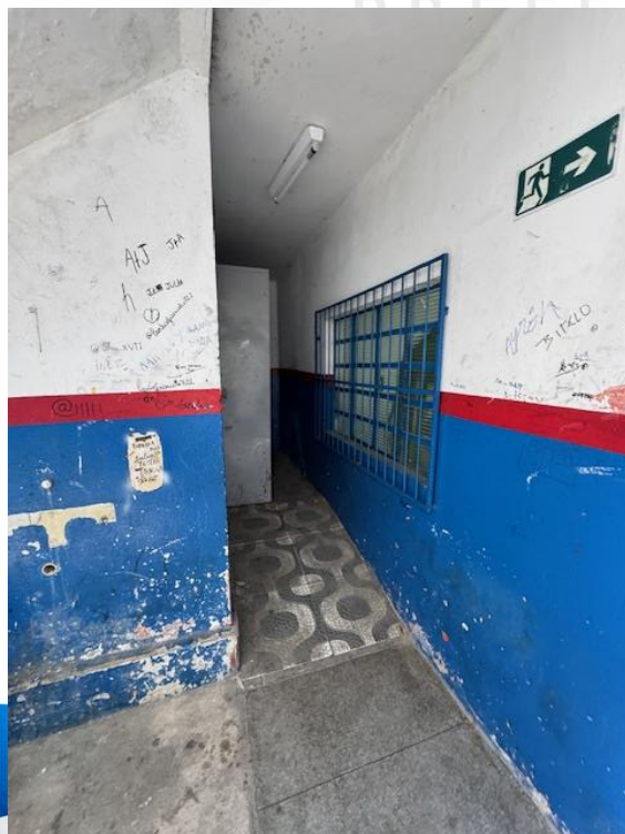
Figura 13 - Manutenções Gerais