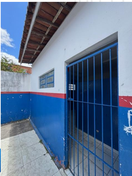
Figura 5 - B.W.C (A ser transformado em depósito)