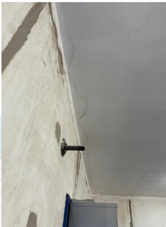
Figura 20 - Manutenções gerais