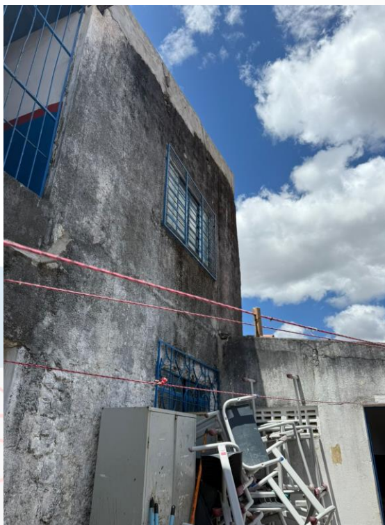
Figura 16 - Manutenções gerais