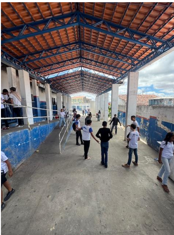
Figura 3 - Pátio (Pintura geral e polimento do piso)