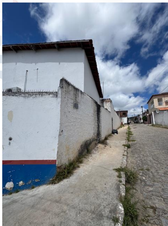
Figura 2 - Fachada Lateral (Pintura)

Endereço: Rua Pedro Toscano, 349, Centro, Tacaratu-PE Cep: 56480-000 Horário de Funcionamento: Segunda a Sexta das 07:30 às 13:30, exceto feriados e pontos facultativo decretado oficialmente