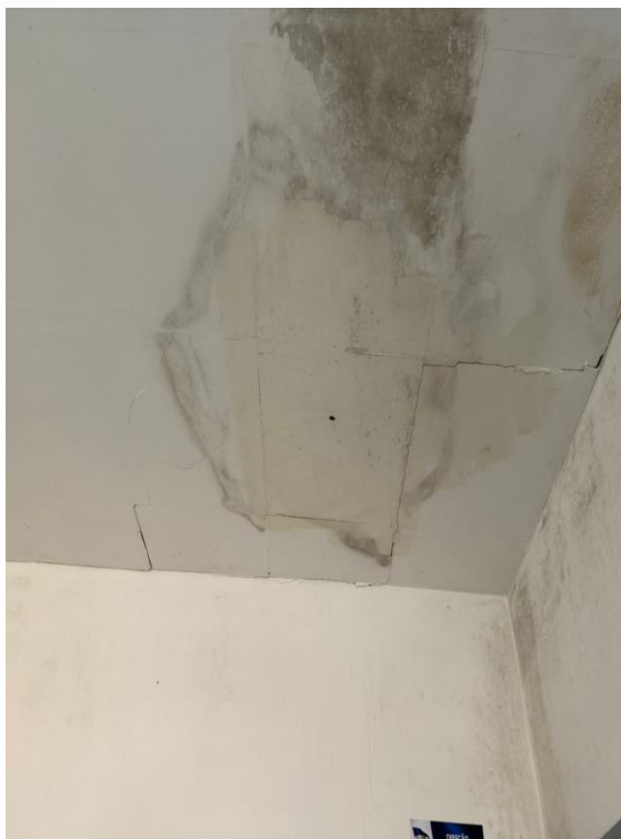
Figura 15 - Manutenções Gerais