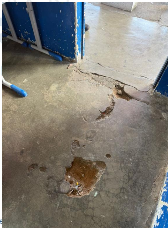
Figura 22 - Manutenções gerais

Endereço: Rua do Comércio, 100 - Tamaritópolis - PE Cep: 56480-000 Horário de Funcionamento: Segunda a Sexta das 07:30 às 13:30, exceto feriados e pontos facultativo decretado oficialmente